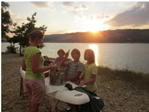
Urlaub im Sportcamp Provence