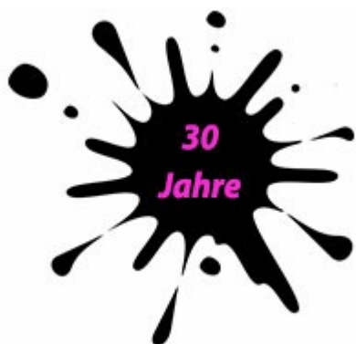
30 Jahre Sportcamp