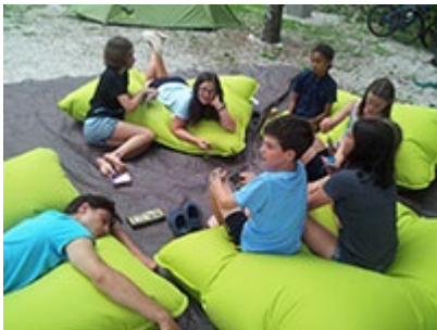
Urlaub im Familiencamp Slowenien