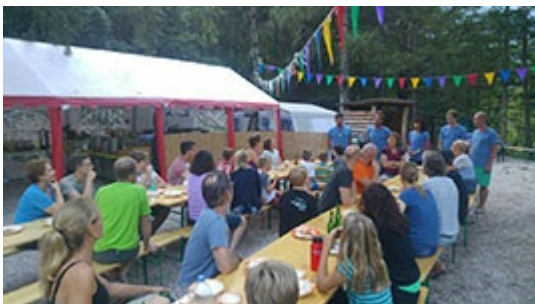
Kochen und Essen