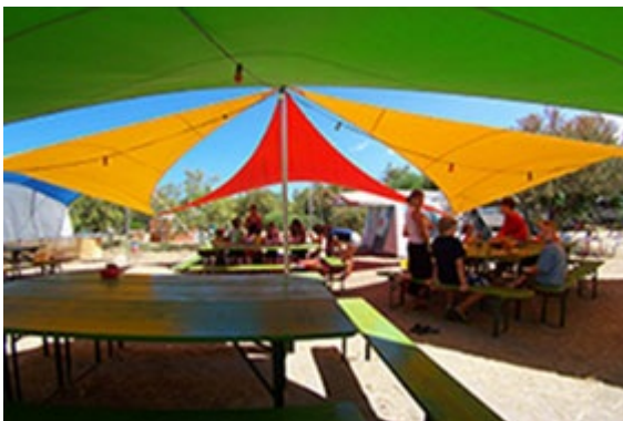
Urlaub im Familiencamp Sardinien