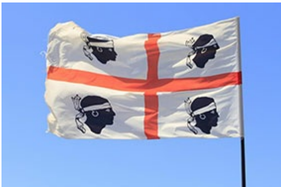
Ausflug zur Festung